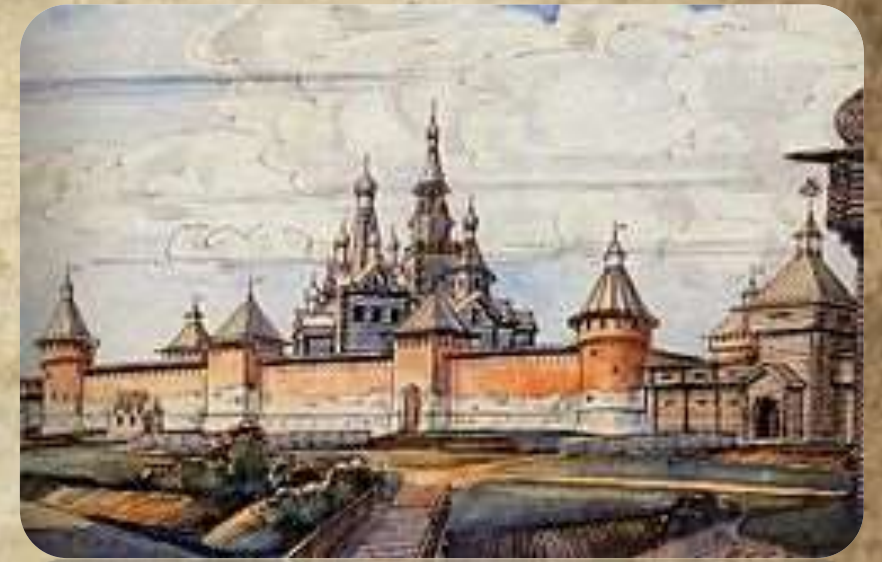
Реконструкция тульского кремля (XVI век)

Строили кремль мастера и каменщики под руководством не известных нам русских зодчих. За 13 лет строительства бригады и мастера менялись. Вот почему у башен и кремля разная кладка, неодинаково выложены зубцы и бойницы.