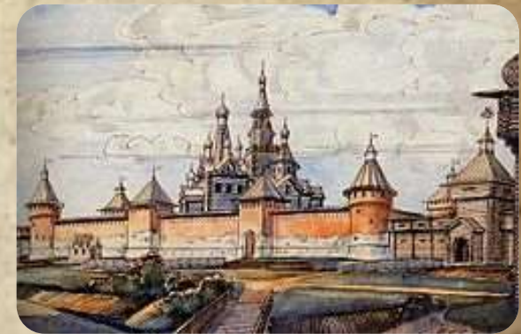
Реконструкция тульского кремля (XVI век)

В 1514-1520 годах «поставиша на Туле град камен» – тот кремль, который сохранился до наших дней. Тула наряду с кремлём Зарайска (1527-1531), Коломны (1529-1531) и Серпухова (1556) надёжно прикрыла Русское государство от врагов.