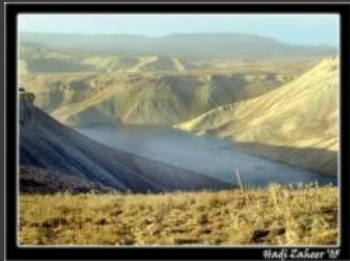
Hadi Zaher '09