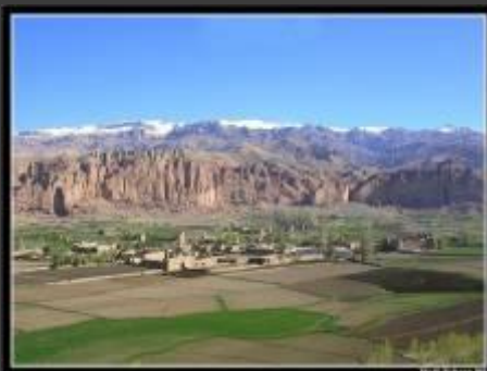
Hadi Zaher '09