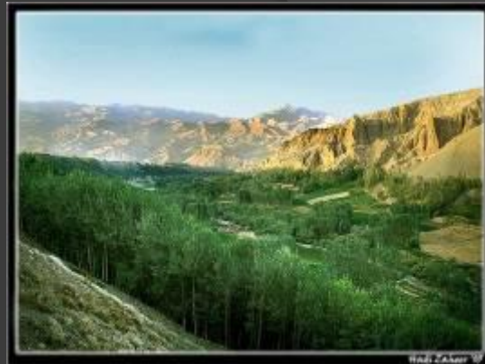
Hadi Zaher '09