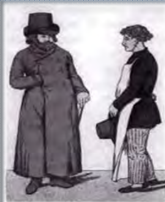
Городские жители первой половины XIX в.