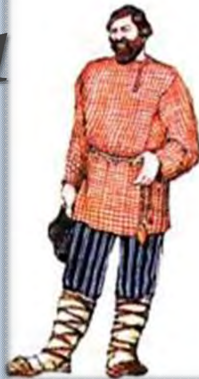
Крестьянин в рубахе-ко- соворотке