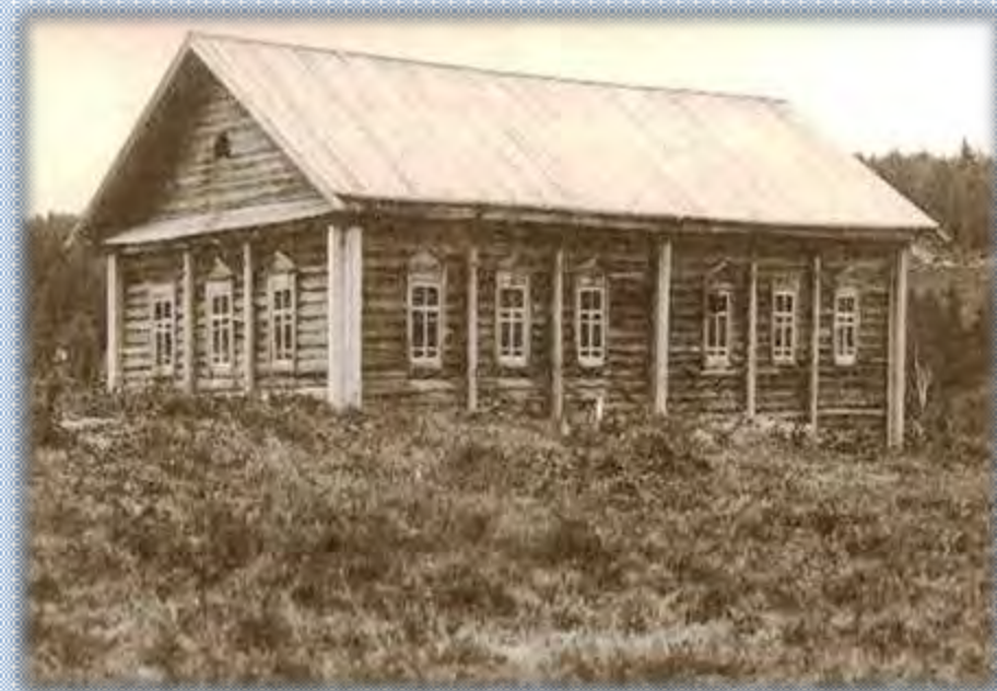
Кувинский завод. Тип рудничной казармы.19 век

Работные люди жили в заводских казармах.