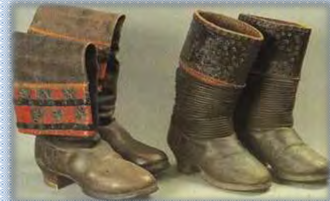
Тяжёлые кожаные галоши «коты»