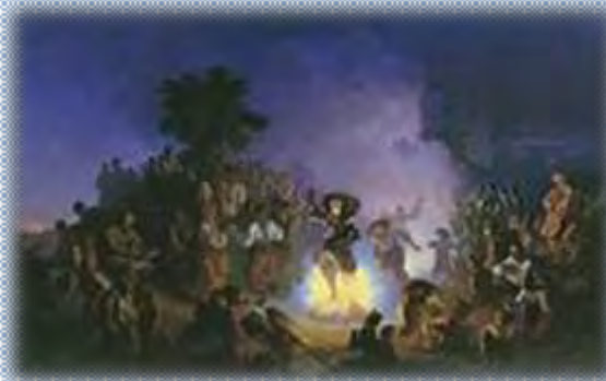
Праздник Ивана Купалы