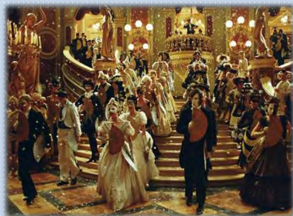
Маскарад, бал для знати, чиновничества.