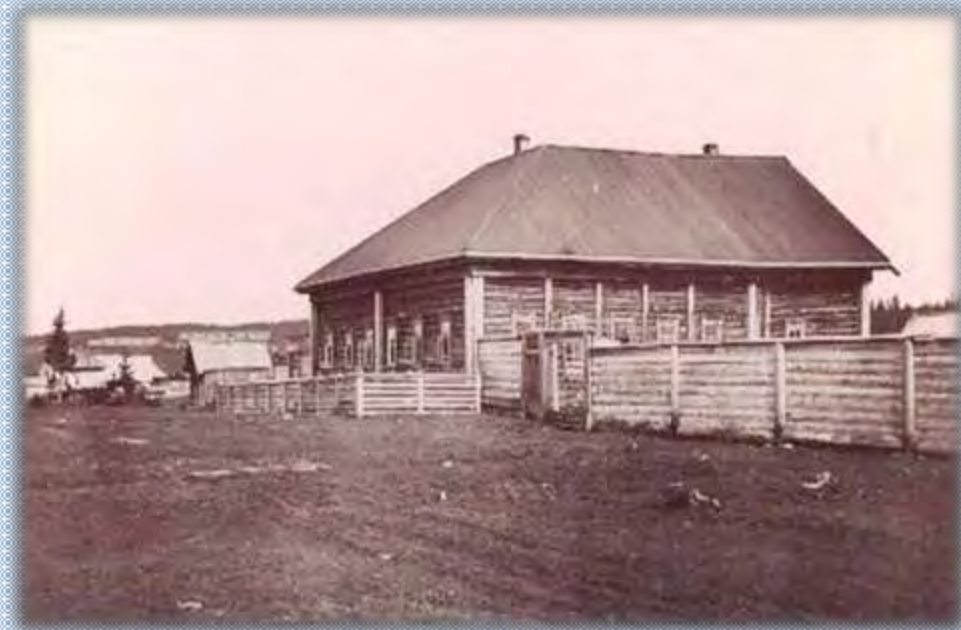
Кувинский завод. Станционная казарма.19 век